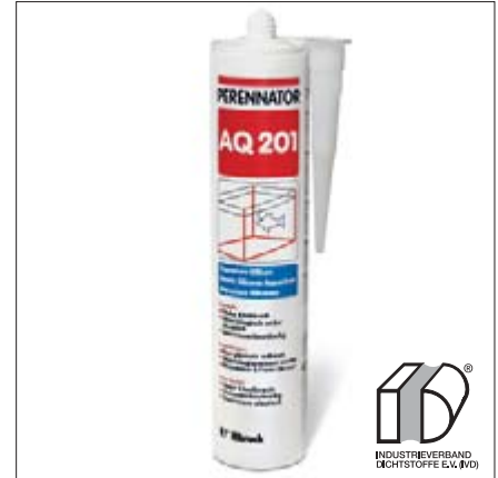
Perennator AQ 201 Aquarium-Silikon